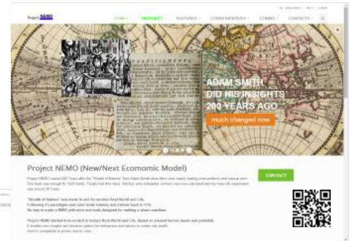
Project Nemo (New/Next Economic Model) http://project-nemo.org