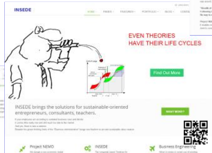
INSEDE (Institute for Sustainable Economic Development) http://insede.org